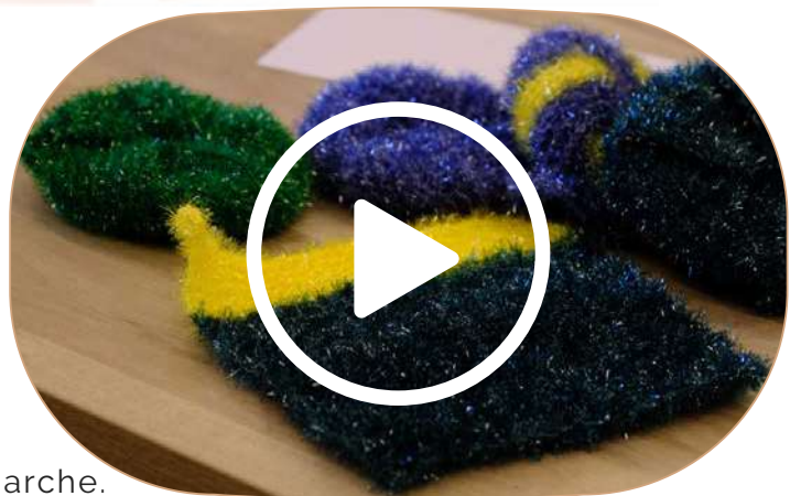
Fabrication de tawashi.

Les produits d'entretien faits maison, les essuie-tout lavables sont beaucoup moins polluants et ils reviennent également beaucoup moins cher. Comme l'indique le Pape dans l'encyclique Laudato Si', « Tout est lié ». C'est gagnant/gagnant pour tout le monde. Lorsqu'elles le savent, les personnes en précarité adhèrent totalement à cette démarche.