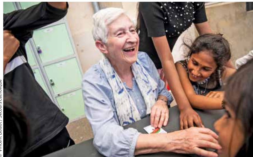
Une journée fraternelle organisée à Meaux par la délégation de Seine-et-Marne du Secours catholique - Caritas France, le dimanche 15 mai 2022.

« Je rêve d'une Église qui prend des risques, accueillant