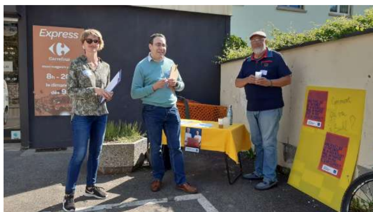
A la sortie de la supérette de Buhl.

Les membres mobilisent leur réseau pour y répondre, mais le constat saute aux yeux : dans le tissu associatif des cinq communes de la haute vallée de Guebwiller, il n'existe pas d'association permettant de répondre à la détresse des habitants ! En novembre 2021, les membres de l'EAP se sont tournés vers Caritas Alsace pour réfléchir ensemble. L'équipe accepte de se lancer dans une démarche d'Animation du Changement Social Local (ACSL), et de prendre part à la formation proposée par le Secours Catholique Grand Est-Bourgogne F-Comté. En mai 2022, quatre personnes se sont posées à l'entrée d'une supérette de Buhl, la plus grande commune du secteur, qui compte 3 000 habitants. En une heure, ces volontaires ont recueilli les avis de 16 personnes, de tous les âges et de tous les profils. Parmi les questions posées aux clients de la supérette : « qu'est-ce que vous aimeriez trouver dans votre vallée qui n'y existe pas encore ? »