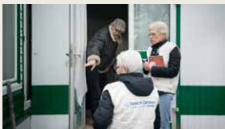
X. SCHWEBEL / S.C.-C.F.

Pour être prête à agir en cas d'inondation, d'incendie, de catastrophe industrielle... Caritas Alsace crée une équipe Urgences qui cherche à s'étoffer.