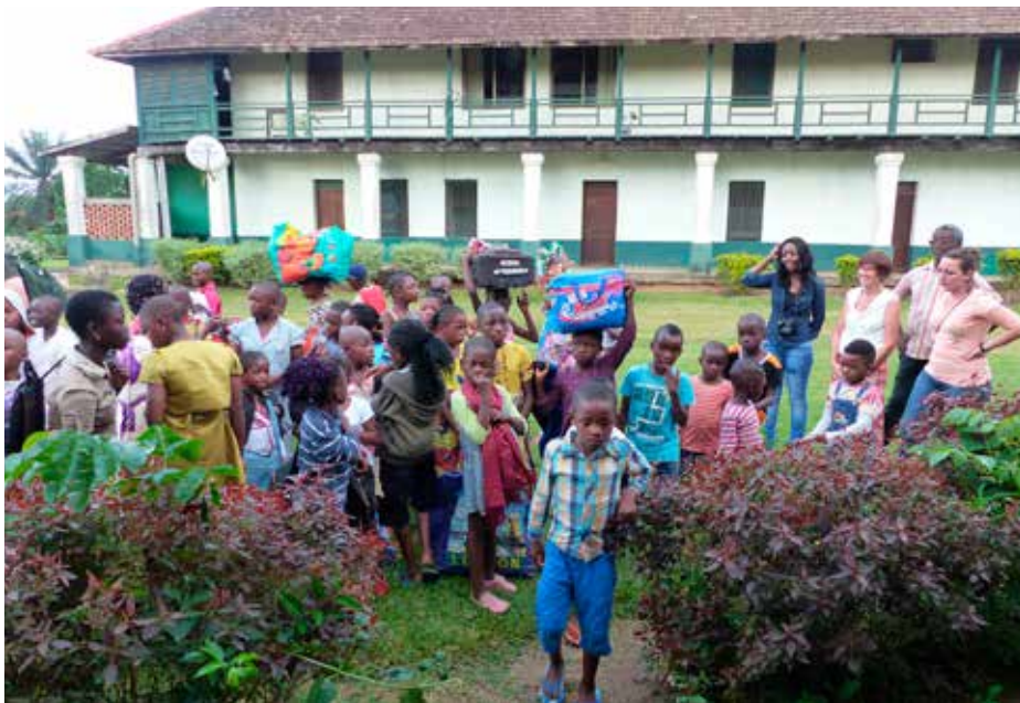
Les enfants, accueillis par les sœurs de la Croix, devant un des bâtiments du patrimoine à restaurer.

Au Cameroun, un projet a pris forme à Akono, près de Yaoundé, en partenariat avec la congrégation des sœurs de la Croix et grâce à la valorisation du patrimoine historique missionnaire.