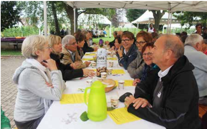
La journée diocésaine en 2015, sous un soleil radieux a laissé de bons souvenirs.