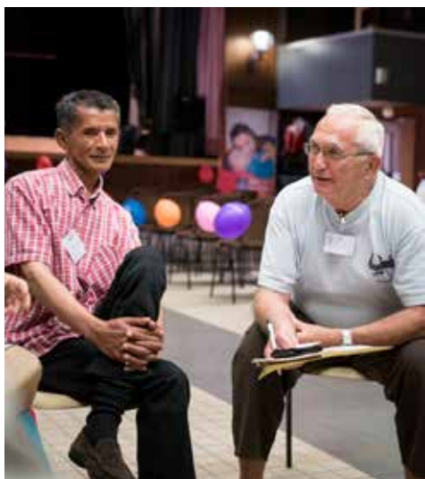
X. SCHWEBEL / S.C.C.F.

Ces dernières semaines, sous l'effet combiné de l'année de la miséricorde et du démarrage du Réseau de l'Espérance*, nous avons sollicité des communautés chrétiennes pour échanger sur ces deux notions centrales de la foi chrétienne. Après une approche étymologique et le recueil de quelques notions théologiques, nous nous sommes retrouvés comme en enfance au temps des belles catéchèses... Pouvons-nous aujourd'hui, dans le monde complexe face auquel chacun est confronté, dans l'Église du pape François, nous nourrir de paroles ?